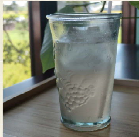
季節の酵素ドリンク

コロンビア産有機栽培の豆を使用 土鍋でじっくり焙煎する事で中心部 までふっくら焼き上がります。 柔らかく丸みのある酸味が特徴の リマテカフェ一番人気のホットコー ヒーです。